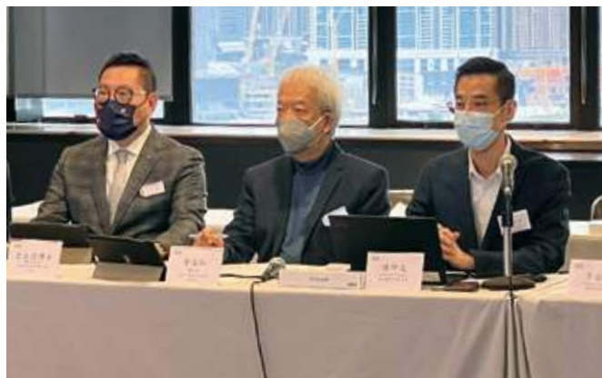
總務委員會舉行第4次會議

香港生產力局宣布推出「資助易 BIZ Expands Easy」網上平台及「資助通」服務，為企業及機構提供一站式政府資助申請渠道，本人於9月16日代表廠商會出席「資助易」的啟動禮，並於活動後即時邀請生產力局到本會向成員介紹該全新服務。