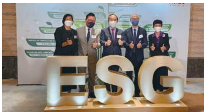
10月27日 史立德會長出席由《香港經濟日報》主辦的「ESG及綠色金融論壇暨嘉許禮2022」，並與主禮嘉賓財經事務及庫務局局長許正宇、香港經濟日報集團執行董事王清等合照