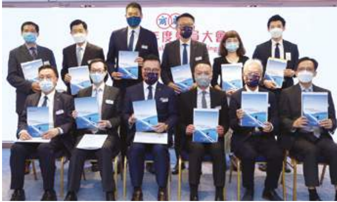
9月29日 廠商會 2022 年度會員大會

「北部都會區」將是香港融入國家發展大局、推動粵港澳大灣區發展的接口，廠商會建議政府，在新界北預留土地打造香港優勢工業的示範基地，並設置「通關緩衝帶」，允許內地科研、工程及技術人員「無障礙」往返深圳與緩衝帶，以紓緩本港人力資源瓶頸。