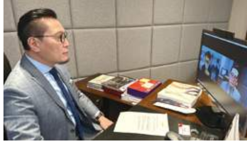
10月31日 史立德會長接受無綫新聞訪問，回應最新的GDP數字