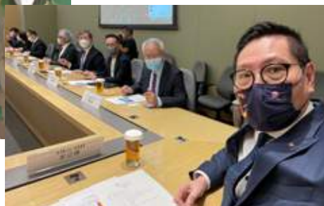
10 月 24 日 史立德會長、永遠名譽會長吳宏斌出席工業貿易諮詢委員會會議，聽取商務及經濟發展局局長丘應樺就行政長官《2022 年施政報告》內相關措施的簡報