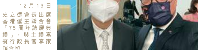
12月13日 史立德會長出席香港僱主聯合會「75周年誌慶典禮」，與主禮嘉賓行政長官李家超合照