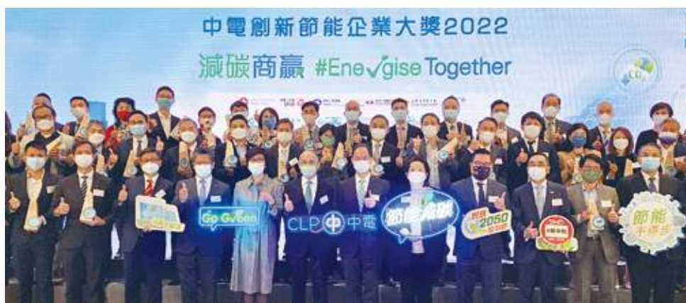
10月26日 史立德會長出席由中華電力主辦，廠商會支持的「中電創新節能企業大獎2022」頒獎典禮擔任頒獎嘉賓，並與中華電力總裁蔣東強等合照