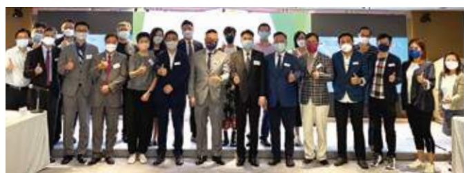
9月14日 廠商會珠寶及玉石業、鐘錶業行業委員會舉行會員分享會，聽取香港海關助理關長胡偉軍就擬設立貴重金屬及寶石交易商註冊制度的說明