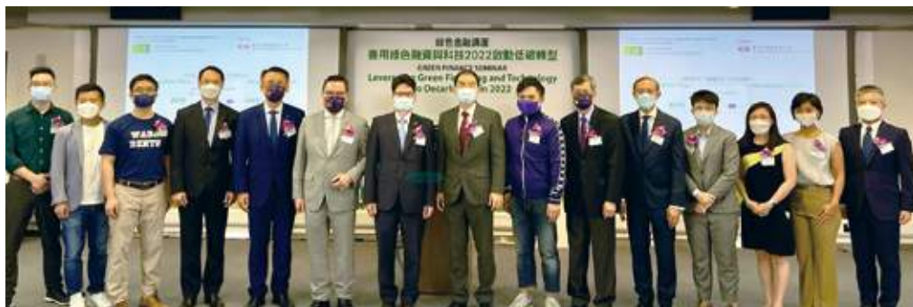
7月29日 本會假HK Tech 300舉辦「善用綠色融資與科技2022啟動低碳轉型」講座。史立德會長、財經事務及庫務局副局長陳浩濂、香港城市大學副校長（研究及科技）楊夢甦教授、CMA檢定中心主席駱百強副會長、行政總裁周瑞麒及一眾嘉賓合照