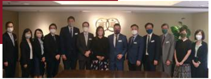
10月13日 勞工處處長陳穎韶蒞會訪問，與本會成員交流

我們很高興《施政報告》採納了我們幾個建議，包括擴大及延長企業支援措施，廠商會亦特別歡迎政府推出《香港創科發展藍圖》、設立100億元「產學研1+計劃」資助大學研發團隊推動科研成果商品化、設立「工業專員」等新措施。