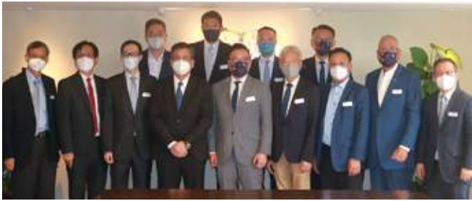
7月19日 商務及經濟發展局局長丘應樺蒞會訪問，與本會成員交流