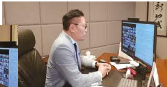
8月24日 史立德會長在線上出席《施政報告》諮詢會，就香港如何提升競爭力，向財政司司長陳茂波提出本會的意見