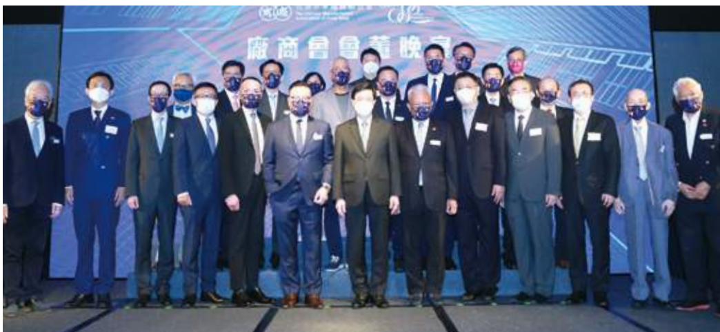
9月29日 廠商會9月份會董晚宴邀得行政長官李家超擔任主講嘉賓，分享政府施政理念