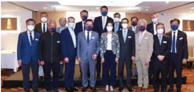
7月28日 廠商會7月份會董晚宴邀得香港海關關長何珮珊擔任分享嘉賓