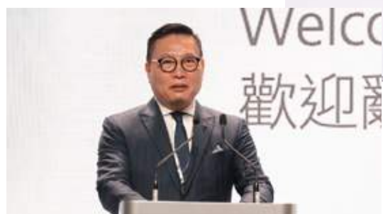
史立德會長在「慶回歸廿五載：迎聚灣區，盈滿機遇」經濟論壇上致歡迎辭

Celebrating the 25 th Anniversary of the HKSAR 慶回歸廿五載 GBA: A Cradle of Opportunities 迎聚灣區 盈滿機遇