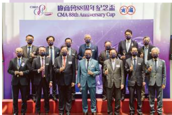
9 月 18 日 「廠商會 88 周年紀念盃」假沙田馬場舉行，一眾首長及嘉賓合照