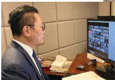
8月8日 史立德會長在線上出席由行政長官主持的《2022年施政報告》諮詢會，並就提升競爭力及建設國際創新科技中心提出多項建議