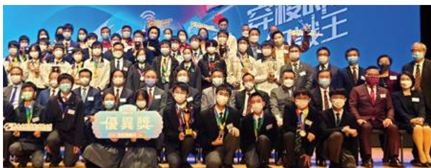
12月9日 史立德會長出席由香港中華出入口商會及聯合出版集團主辦的「全民國情知識大賽」頒獎典禮，並與主禮嘉賓政制及內地事務局局長曾國衛等合照