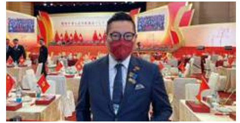
10月1日 史立德會長出席香港特別行政區慶祝中華人民共和國成立73周年活動