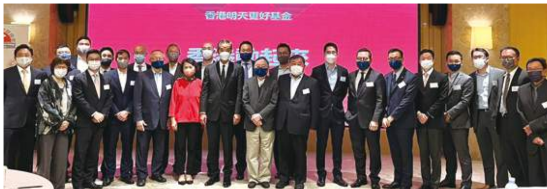
11月24日 史立德會長出席香港明天更好基金舉辦「香港動起來」活動，大會邀得全國政協副主席梁振英擔任分享嘉賓