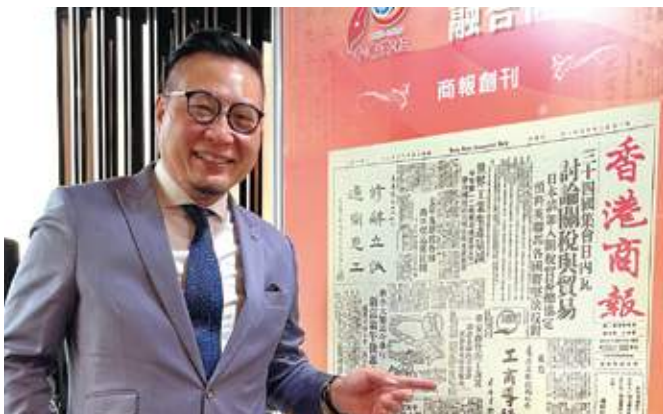
12月8日 史立德會長出席香港商報創刊70周年誌慶酒會