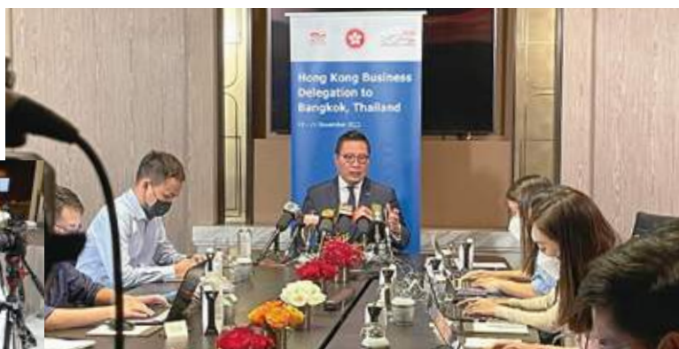
11月21日 史立德會長在泰國接受各大傳媒訪問，總結香港商貿團出訪泰國的成果，以及東盟市場的發展潛力