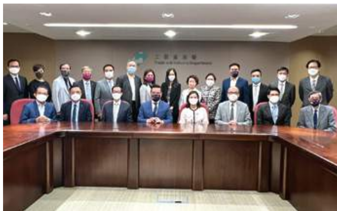
工業及貿易委員會與中小型企業委員會前往工業貿易署拜訪黃少珠署長

10月14日，工業及貿易委員會與中小型企業委員會在史立德會長、盧金榮常務副會長及本人的帶領下，前往工業貿易署拜訪黃少珠署長；雙方就推行「再工業化」、協助企業克服經營困難、促進大灣區經貿合作等議題交流意見。