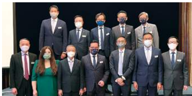
10 月 25 日 瑞士信貸銀行舉辦「廠商會 88 周年：瑞士信貸銀行午餐會」，並邀得陶冬博士擔任嘉賓，就 2023 年環球經濟展望作出分享