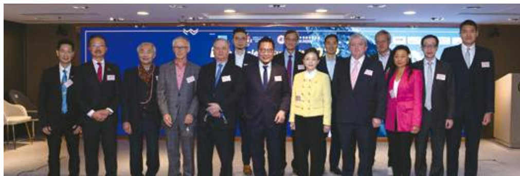
12月1日 本會與國際可持續發展學院合辦的「Blue Society Summit 2022」