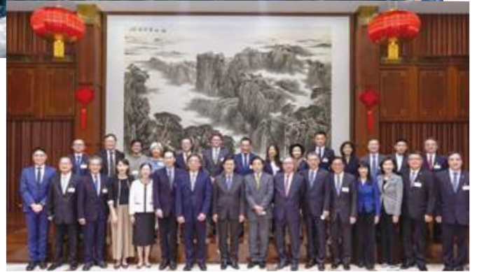
11 月 19 至 21 日 史立德會長隨行政長官所率領的香港商貿代表團赴泰國曼谷訪問