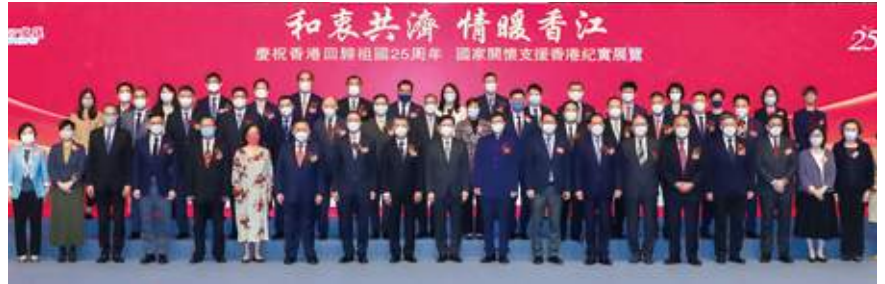
11月30日 史立德會長出席由香港大公文匯傳媒集團主辦，本會協辦的「和衷共濟 情暖香江—慶祝香港回歸祖國25周年 國家關懷支援香港紀實展覽」開幕典禮，並與主禮嘉賓行政長官李家超及一眾嘉賓合照