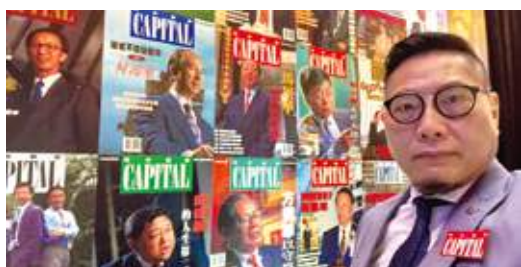
12月8日 史立德會長出席資本雜誌35周年活動