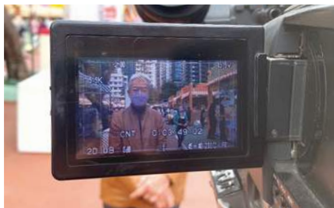
黃家和副會長接受《「廠」造未來》電視特輯訪問

委員會聯同各行業召集人參與12月1日由香港金融管理局及香港海關舉行的「商業數據通」(CDI)專場諮詢會議，就中小企業對CDI數據的使用以及運作提出意見。