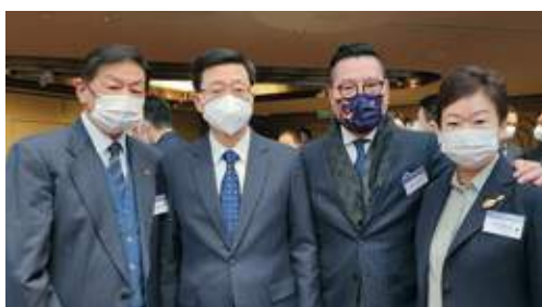
12月14日 史立德會長出席「第25屆北港經濟合作研討會開幕式暨京港合作峰會」，與行政長官李家超合照