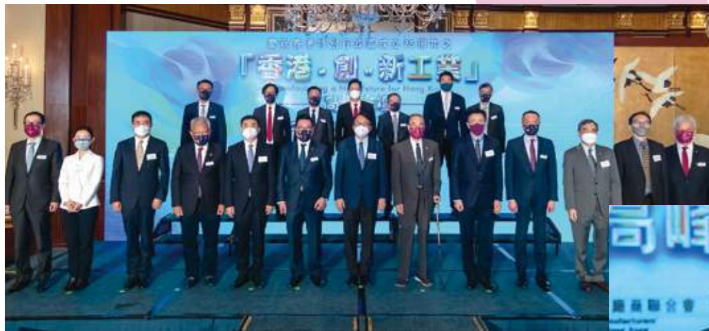
7 月 22 日 本會假港島香格里拉大酒店舉辦「香港·創·新工業」高峰論壇