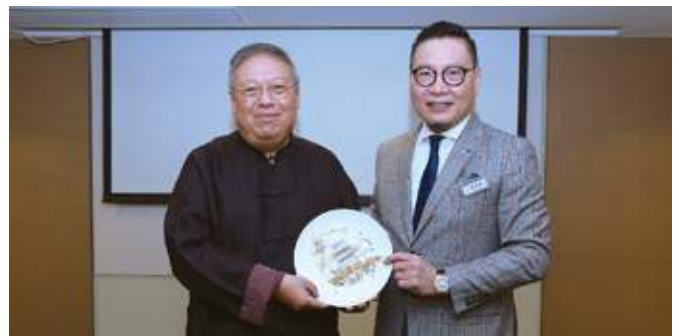
10月28日 廠商會10月份會董晚宴邀得前民政事務局局长何志平醫生擔任嘉賓，分享對香港經濟環境的看法