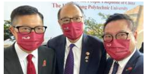
10月1日 史立德會長出席理工大學升旗儀式，與保安局局長鄧炳強及理大校董會主席林天輝合照