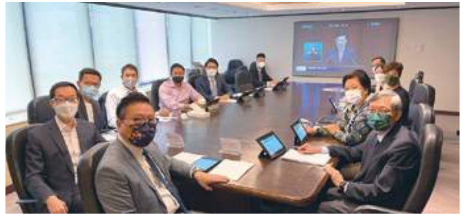
10月19日 政治及經濟事務委員會成員收看《2022年施政報告》電視直播，並就此進行討論