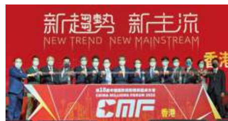
10月21日 史立德會長代表本會擔任「第18屆中國國際保險精英圓桌大會」開幕式的主禮嘉賓，並與財政司司長陳茂波、CMF 港澳台秘書長鄧錦添博士等合照