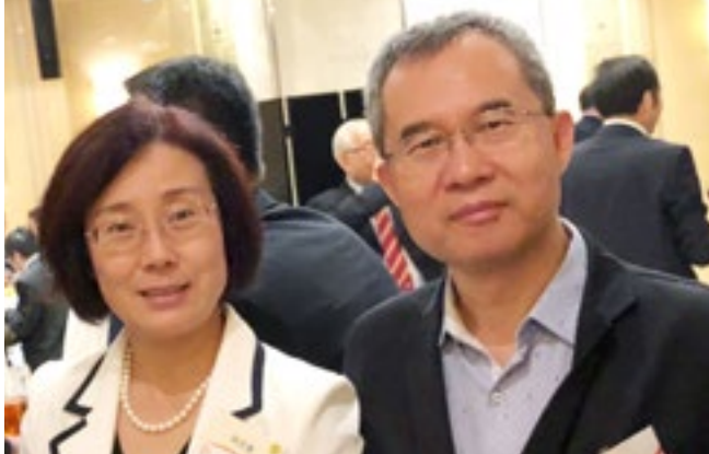
「香港貿發局宴請江西省吳忠琮副省長」於 6 月 14 日假會展廣場皇朝會舉行。本會吳清煥副會長(右)代表本會出席，並與江西省吳忠琮副省長(左)會面。