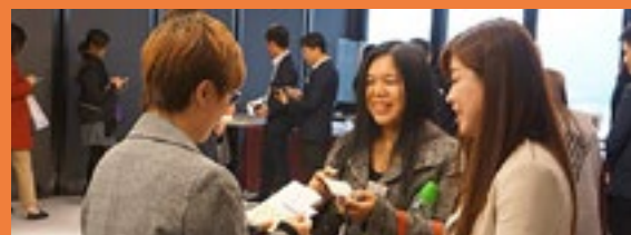
會員商聚 CMA Bar Time 日期 Date : 12 / 7 / 2019 查詢電話 Enquiry Hotline : 2851 1555