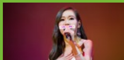
廠商會好聲音初賽 Voice of CMA 日期 Date : 9 / 8 / 2019 查詢電話 Enquiry Hotline : 2851 1555