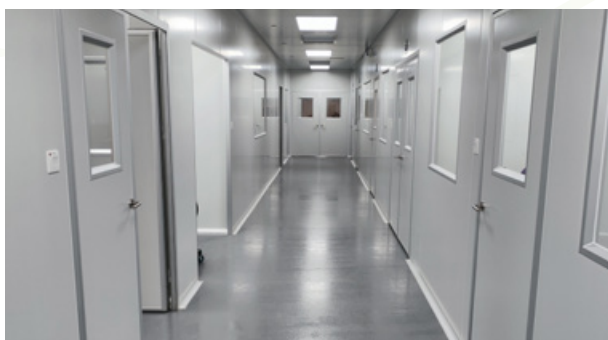
Class 7 認證無塵室

自 2003 年以來，CATALO 一直致力於提供天然純正以及優質的營養健康食品，並選用來自世界各地多個品牌以及具有專利技術的天然成分，經多項研究證實有效改善健康，能夠全面照顧不同人士的營養需要，助你享受豐盛人生。