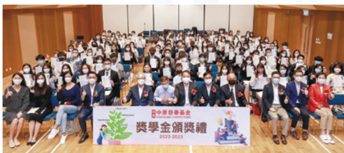
2022-23 年度獎學金嘉許禮於去年 11 月 26 日假灣仔香港童軍百周年紀念大樓舉行，嘉許成績優異的學生，並提供機會讓學生認識及交流。

「中原慈善基金獎學金」為「慈善基金」其中一個重點項目，目的是獎勵及協助應屆香港全日制成績優異及有經濟需要的高中畢業生，在本港、內地或海外大學繼續升學。此外，「中原慈善基金」為鼓勵學生把握交流機會，設立交流助學金，資助學生在學期間往外地參與交流生計劃，增廣見聞。基金亦有資助學生考取專業試，及應付學習所需的裝備。「獎學金」於 2011 年開始，迄今已設立十二年，共資助 1,614 人次，撥款總額超過港幣 4,600 萬。