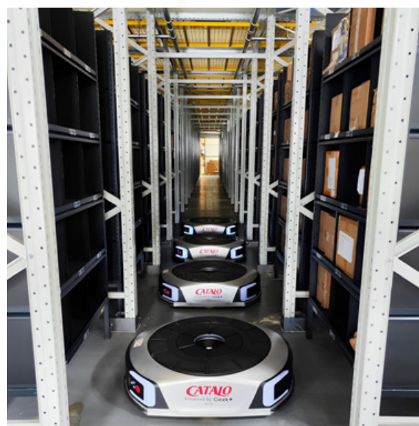
自動導航搬運機械人

CATALO 天然健康食品智能生產中心位於科技園的創新園醫療用品製造中心。集團透過「新型工業化」的技術，令生產過程全自動化智能生產，實現無人生產線，從設計、生產、銷售，整個產品生命週期都重視減少資源消耗和環境污染，兼顧可持續發展，配合碳中和願景。智能生產中心配備 cGMP，ISO，HACCP 等國際認證，主力發展個人化保健食品的生產和包裝。此外，生產中心設有全港首家上存下揀智能倉庫，打造由地面至天花板 14 米高的立體存儲空間，大幅提升庫存空間。透過智能機器人及智慧演算法，達至高效的貨到人揀模式，提升出庫效率。集團將於香港投入研發、設計及生產優質天然健康食品，與本地大學、科研機構等研發合作，以可持續發展的模式走入粵港澳大灣區重點市場。