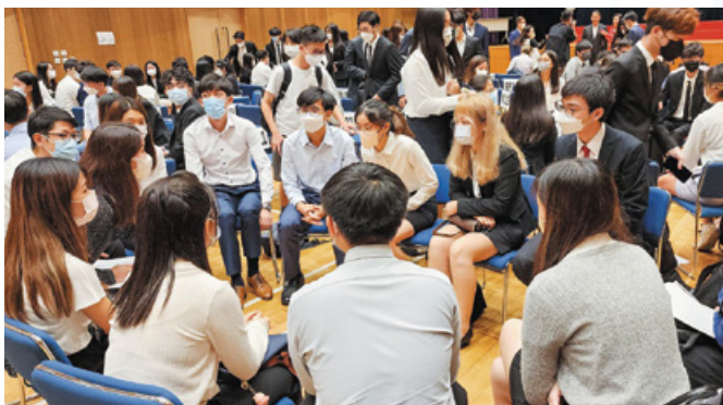
嘉許禮設有交流環節，讓一眾中原學人可交流學習心得，認識互助

曾獲取獎學金的畢業生以專業知識回饋社會，部份畢業生更籌組成立中原學人協會，提供資源及平台供學生交流及互助，支援新進入大學的學生，及籌辦活動讓中原學人服務社會。中原學人協會亦是一個網絡接觸不同層面的機構，了解社會所需，推薦予中原慈善基金。