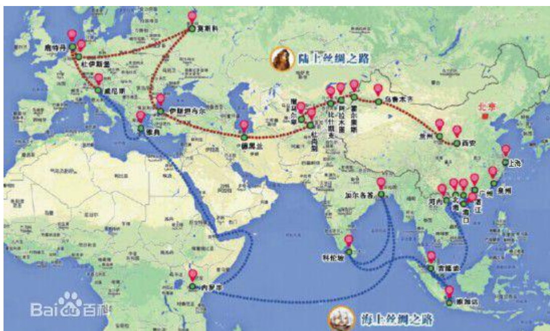
附圖 1：「絲綢之路經濟帶」和「21 世紀海上絲綢之路」的地理範圍