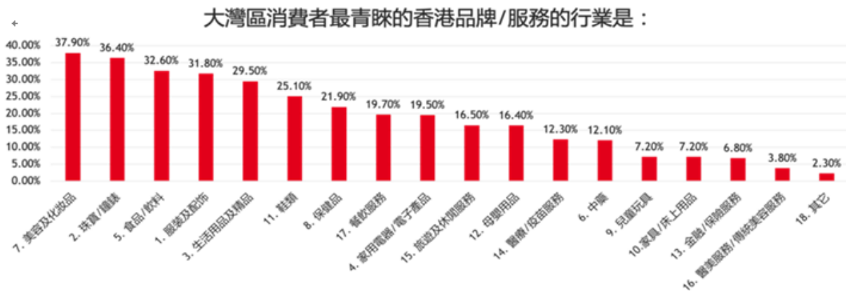
圖 2：大灣區消費者最青睞的香港產品/服務品牌的排名

另一方面，隨著新興中產家庭的崛起，大灣區消費者的整體素質逐步提高，對舒適的購物環境和服務標準期望日益提升，促使當地購物中心的數量呈爆發式增長。過去十多年來，大灣區購物中心的數量以每年 25% 左右的增速從約 900 家增長到 6,000 多家。僅在 2019 年，大灣區內地 9 市新開的購物中心就多達 500 個，2020 年又新增 190 多個購物中心；在商場配套日漸完善的同時，彼此間的競爭亦愈見激烈。