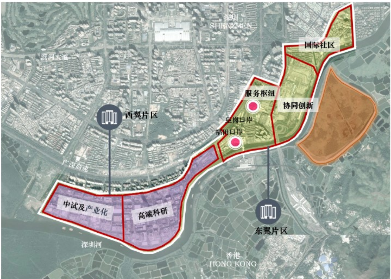
附圖：河套深圳園區「一心兩翼」的總體空間格局